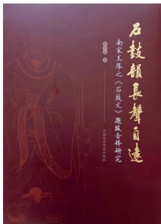
《石鼓韵长声自远：南宋王厚之〈石鼓文〉题跋音释研究》 斯多林著 中国美术学院出版社 2025年12月

通读《王厚之集》，斯多林更深入地了解了王厚之生平性格、为人处事。王厚之少年时“博雅笃学，世味冲淡”；在朝廷为官时有大局观，做事能够投入