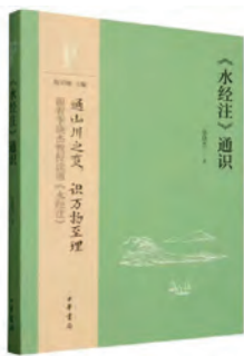
《〈水经注〉通识》 李晓杰著 中华书局 2025年6月

在酈道元的故乡河北，酈道元《水经注》广受赞誉。如有“90后”复旦大学校友就认为：《水经注》是中国古代一部集大成的经典，被誉为“宇宙未有之奇书”。“然而，因其文字古奥、涉及的地理脉络