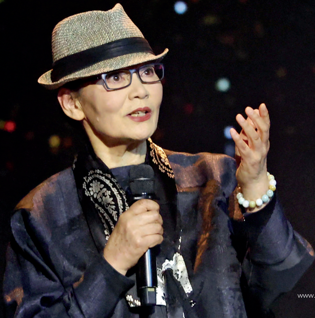
潘虹出席上戏校庆。