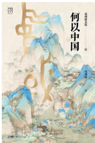
《何以中国》 葛剑雄著 广东人民出版社 2025 年 3 月

如新年元月里，京杭大运河江苏无锡段的明珠枢纽黄埠墩经修复性保护工程后向社会各界和各国旅游者开放。黄埠墩又名小金山，坐落于吴桥以南、惠山滨口古运河中心，四面环水、地势独特；有运河之心美誉。我在 1986 年夏造访过这一宝地，一晃 40 年过去了！