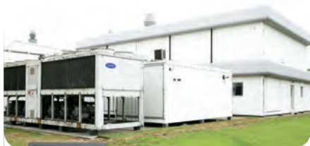
○ 法玛西亚有限公司 [ 辉瑞制药（无锡）有限公司前身 ] 在无锡成立

辉瑞制药（无锡）有限公司成立于 1995 年，是辉瑞公司在华投资设立的独资企业。从公司成立至今的 30 年中，辉瑞无锡跟随无锡本地乃至中国医药产业一起蓬勃发展，不断壮大。秉承“以患者为中心”的承诺，辉瑞致力于加速推进创新药进入中国市场，并积极评估多款产品在辉瑞无锡落地的可行性，造福患者及中国健康生态系统。