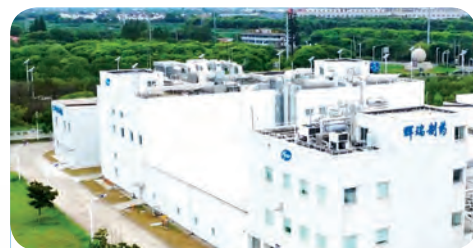
○ 无锡工厂 108 善若楼 & 110 智信楼建成