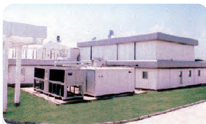
○ 法玛西亚有限公司正式商业化生产