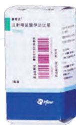
○ 善唯达 5mg&10mg 获批