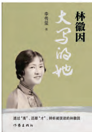
《林徽因：大写的她》 李传玺著 作家出版社 2025年10月

作者从林徽因的童年讲起，开篇即提出了新的观点。林徽因的名字出自“大姒嗣徽音”，承载着林家开枝散叶的期许。林长民后娶程桂林后，将自己的书房改作“桂林一枝室”，是否可以断言程氏受宠，进而得出林徽因及其母亲备受冷落的结论？作者用常被忽略的印章细节反驳了这个世俗观点。林长民携长女欧游归国后，他写信给女儿，鼓励她理性考虑日后发展方向：“究竟汝志愿如何，对于婚约，对于嫁期，对于赴英续学，对于留家自习，或入何校，或聘何师，或治中国学，望汝能有一种自择而又审慎的意见表示。”充分表现出对长女的支持和重视。而在这封信后，林长民就用了“桂林一枝室”的红印。若果真如大家揣测，林徽因及母亲因为程氏备受冷落欺负，那么林父为何会在一封讨论长女发展前景的信中使用此印？作者给出了他的答案：“桂林一枝”或许就是林父对家中几个子女的期许，希望他们能在桂林群才当中折取一枝，是对子女个人发展的美好祝愿。作者开篇就表明了自己对林徽因研究的态度：在家长里短、八卦