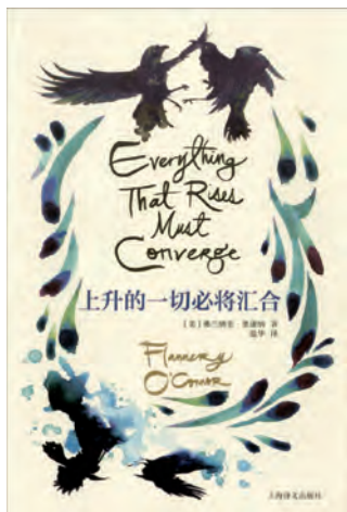
《上升的一切必将汇合》 [美] 弗兰纳里·奥康纳著 上海译文出版社 2024年11月

《林中风景》开头的汽车、保险杠、引擎盖作为道具，在《格林利夫》里面成为梅太太的归宿。一头公牛跑到梅太太的