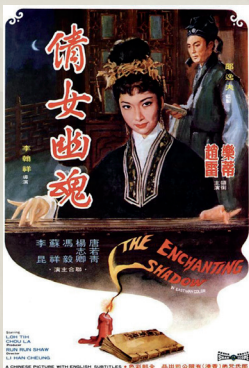
1960年李翰祥拍摄《倩女幽魂》。