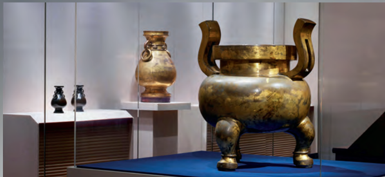
本次大展是近年来海内外最具规模的史诗级宋元明清文物大展。

铜器艺术的最全面回顾，无疑也填补了研究上的缺憾，更是古老而辉煌的中华文明一次响当当堂堂“走出去”、站上国际舞台的文博盛事。