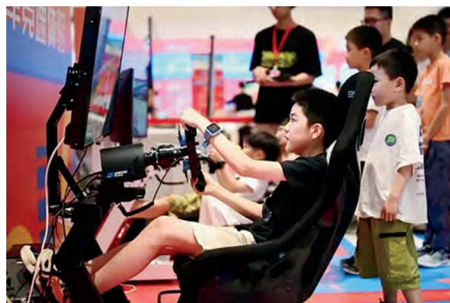
模拟赛车让小朋友体验到速度与激情的碰撞。

其中，尚体健康科技作为第四届市民运动会上海室内健身嘉年华的承办方，在接受《新民周刊》采访时介绍，今年的嘉