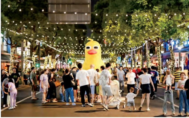
周末的大学路限时步行街，成为市民游客的购物游玩好去处。

启动升级改造，告别现在的业态，力争实现华丽转身。据悉，商场将引入南京东路百联ZX创趣场的营业模式，聚焦“二次元”、泛“二次元”、潮流青年三大主力客群进行升级改造，探索二次元商业消费新业态，今年年底改造完成后，这也将成为南京东路后上海第二家百联ZX。