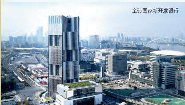
金砖国家新开发银行

金砖国家领导人第六次会晤在巴西福塔莱萨举行。五国签署协议，成立金砖国家新开发银行，建立金砖国家应急储备安排。