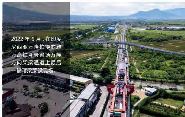
2022年5月，在印度尼西亚万隆拍摄的雅万高铁4号梁场万隆方向架梁通道上最后一榀箱梁架设现场。

四国在协商一致基础上，正式吸收南非加入机制。机制英文名称更新为“BRICS”。“金砖四国”也因此改称为“金砖国家”。