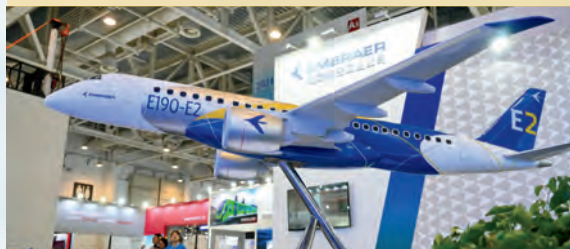
在厦门举行的2024金砖国家新工业革命巴西展展出的E190-E2飞机模型。

2024年是“大金砖合作”开局之年，“金砖大家庭”实现历史性扩员后，习近平主席在喀山同金砖国家领导人首度线下聚首。