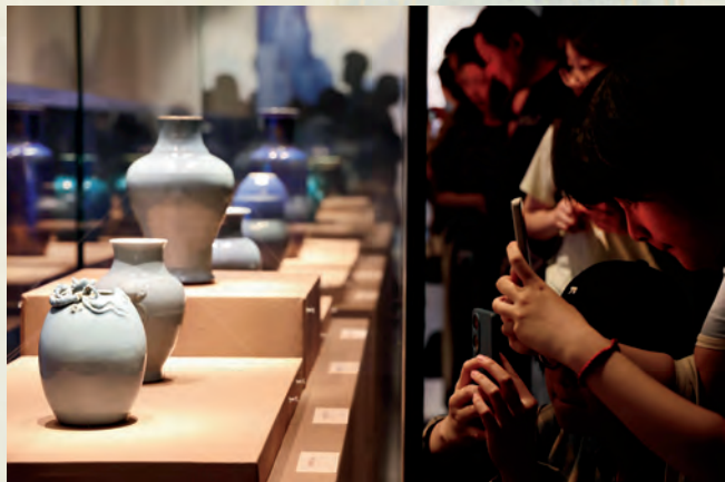
2024年5月18日，“只此中国色·青”亮相南京六朝博物馆。

清供光彩华贵，翡翠碧玺蝠寿佩轻盈通透，粉青釉天青釉近乎半透明的玲珑，绿釉孔雀蓝釉深沉庄重，而唐代的长沙褐绿彩云纹瓷壶中呈现的褐绿色又是另一种浑朴滋味，点翠镶宝花卉簪和镀金点翠镶宝仙山楼阁簪让人见识古人精湛的技艺，当然也少不了“青花”这位大员——“青花番莲蕉叶赏瓶”又名“玉堂春瓶”，创烧于清雍正朝，因主题图案青花缠枝莲纹寓意清正廉洁，常被皇帝赐予臣子，故名“赏瓶”。通体的海水纹、如意云头、蕉叶、缠枝莲花和卷草纹饰，美不胜收。