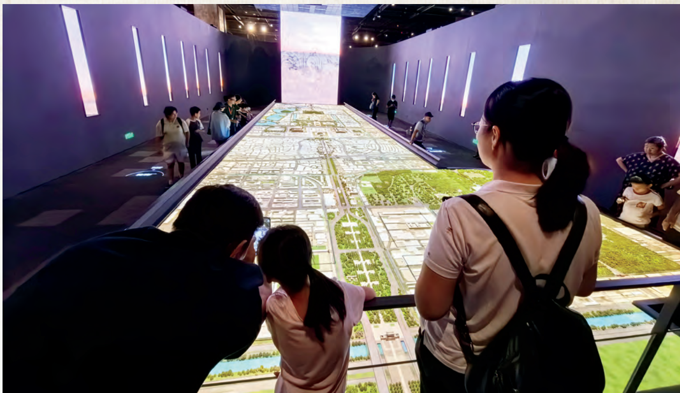
市民在首都博物馆参观“北京中轴线”展览。

北京中轴线申遗成功使北京的世界文化遗产达到8项，是全球拥有世界文化遗产数量最多的城市，对于提升北京城市形象意义重大。不过在吕舟看来，北京中轴线申遗成功并不是终点，对于北京来说，接下来要做的，是通过北京中轴线这一文化财富，形成更大的社会凝聚力，推动社会可持续发展。“其实在申遗过程当中，很多都已经实践过。接下来就看政府如何进一步投入力量了。”吕舟表示。