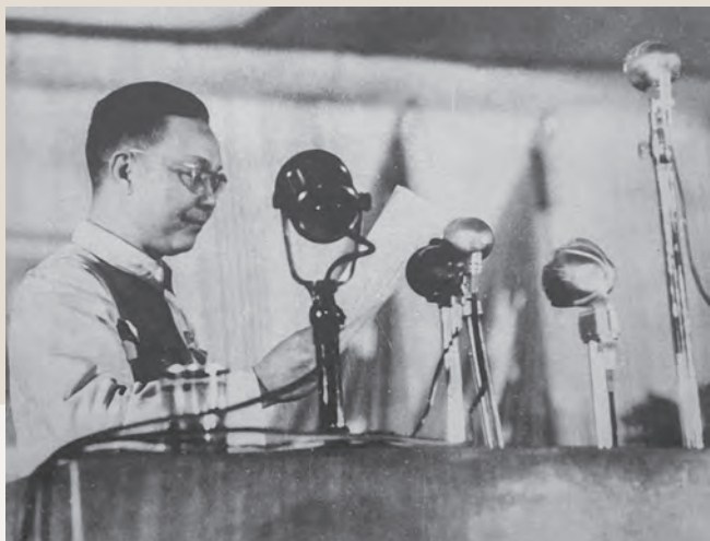
1949年，周信芳在第一届政治协商会议上发言。

目，到申新五厂、国棉一厂等处演出。其中有一个节目是《升官图》，由江南名丑刘斌昆主演。这说明，经过剧影协会的工作，一些著名京剧演员已被吸收和动员到迎接解放的队伍中来。