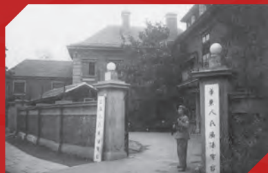
上海人民广播电台旧址。

1949年5月27日，上海全境解放。当晚，位于大西路7号（今延安西路129号）已经被上海人民团体联合会和人民保安队保护起来的上海广播电台，改用上海人民广播电台名称正式向全市播报，主要内容是上海解放的消息和人民解放军的“约法八章”。