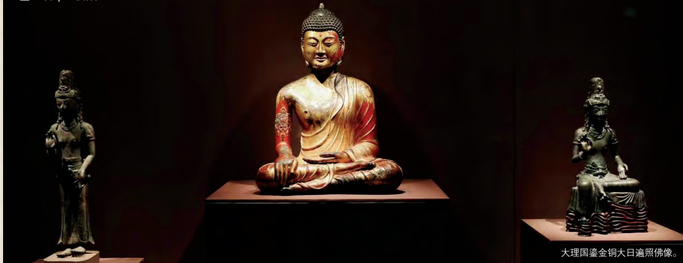
大理国鎏金铜大日遍照佛像。

作为全新的城市文化地标，自上海博物馆东馆试运营以来，好展不断，观者如云。近日，上博东馆的第二个常设展厅——中国古代雕塑馆经过全面升级、创新改陈开放，为观众呈现在海内外独树一帜、“教科书”式的中国古代雕塑艺术通史陈列。