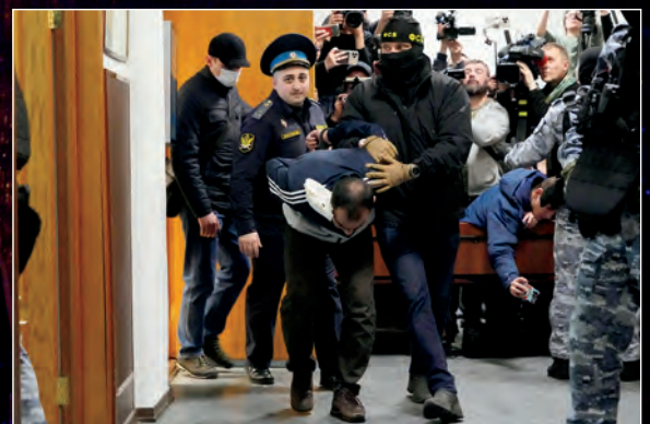
下图：3月24日，在俄罗斯莫斯科，一名嫌疑人在巴斯曼区法院被押送至被告席。

11月和12月之间，普京总统多次和美方进行沟通对话，美国情报系统也就由此感知到俄想要干哪些事，所有的情报侦测的‘传感器’只要看到俄军的动态和部署，就能推算出来大体爆发冲突是哪一天。”王强说，“按照这样一个情报能力，在今年3月初，美国情报系统到底得到了什么信息？美方何时、通过