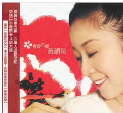
黄韵玲专辑《春暖花开》。