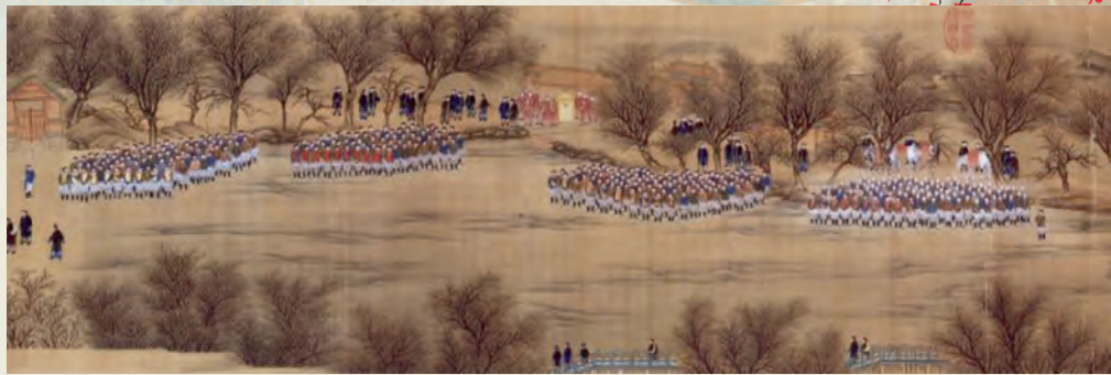
《冰嬉图》右侧“抢球”队伍。

获胜者同样能得到皇帝的“恩赏银”。据《清朝文献通考》中记载：“陈伎毕，恩赏银两头等三名，各赏银十两。二等三名，各赏银八两。三等三名，各赏银六两。其余兵丁各赏银四两。俱有内府广储司支給。”计算下来，赏银的总数在上万两之巨，“冰嬉”一次，宫廷开销不小。