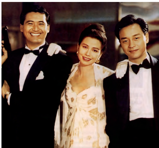
《纵横四海》见证了香港电影的黄金时代。

《林之女仆》创作于1874年。画的是一个阿拉伯风情的片断，虽然简朴，却十分迷人。你看画面上裸露上身的女仆，面容端庄而忧郁，整幅画都洋溢着浓浓的东方情调。