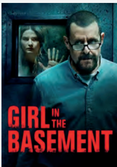
奥地利地下室环境