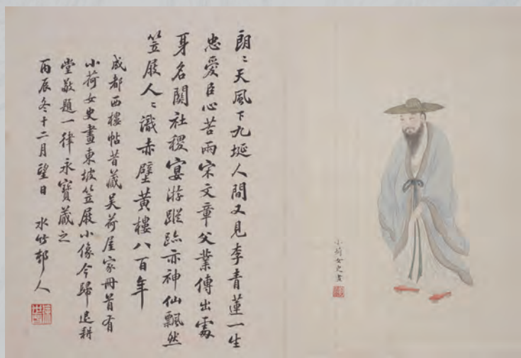
西楼苏帖，吴尚熹绘东坡居士像