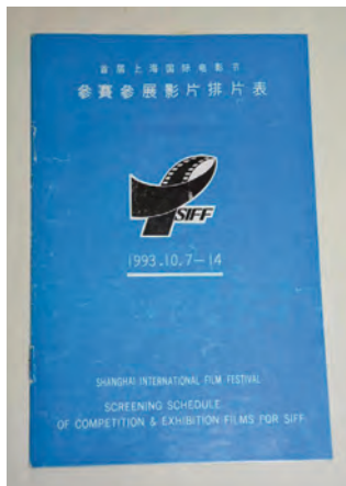
第一届上影节珍贵藏品。