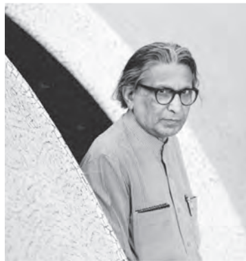
上图：印度建筑大师巴克里希纳·多西。 左图：多西设计艾哈迈达巴德洞穴画廊。

多西带有印度特色的批判性地域主义建筑，在极具雕塑感的混凝土和砖砌体量中实现。他在