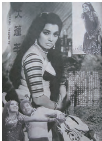
左图：风靡一时的印度电影《大篷车》。