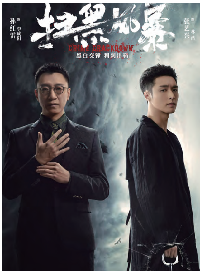
2021年的爆款《扫黑风暴》。

该剧既硬核写实，比如剧情取材自孙小果案、操场埋尸案等真实案件，涉猎了套路贷、行业垄断、暴力拆迁等社会痛点，同时也注意虚实结合，故事性极强。该剧最有看点的还是演员的演技，孙红雷、刘奕君、王志飞同框飙戏，情绪表达细腻传神，