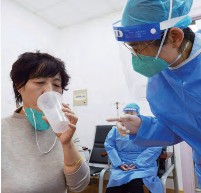
2022年12月19日，在上海黄浦区老西门社区卫生服务中心，一些居民前来接种吸入式新冠疫苗。