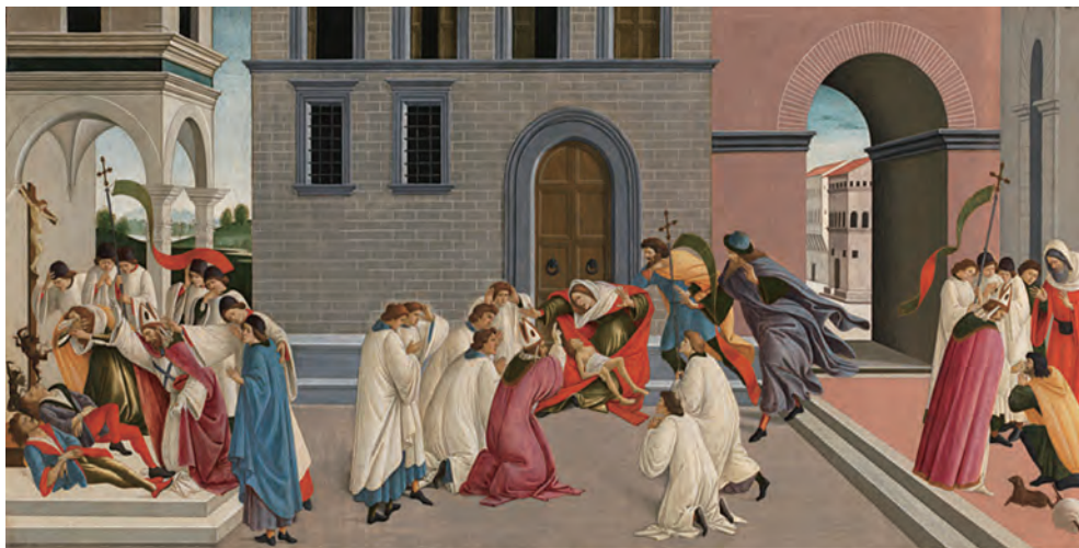
下图：《圣泽诺比乌斯的三个奇迹》，作者：桑德罗·波提切利。

而到了“拉斐尔和意大利文艺复兴全盛期”，观众则将通过视觉直观感受，充分了解到——“文艺复兴”意为“重生”，是对古希腊古罗马艺术、科学和文化的致敬和再度发现，14世纪末起源于意大利，至16世纪初发展到全盛期。此次参展作品包括文艺复兴时期伟大的艺