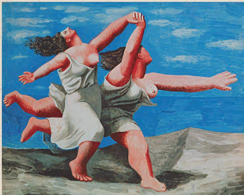
毕加索《沙滩上奔跑的两女人》。

比起兄弟年份的1919、1921、1927、1922在历史长河中略显微波不惊。彼时，美国正处在“喧嚣的20年代”（Roaring Twenties）初，一切有待酝酿；欧洲则于战后自添伤口，还盯防着苏维埃新政权；中国军阀混战正酣，新文化运动方兴未艾；非洲、拉美、亚洲的其它国家，大多被殖民主义和帝国霸权笼罩。然而，人们多少有些“百年情结”；并且，关于1922，难道乔伊斯、伍尔芙、芥川龙之介那些在当年出版的文学杰作不值得一谈吗？