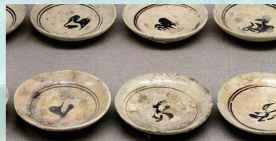
元代磁州窑白地黑花碟。