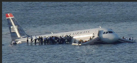
迫降在哈德逊河上的1549号航班。

长避开人烟稠密地区，冒险迫降在哈德逊河上， 155名乘客和机组人员毫发无损，全部生还 。