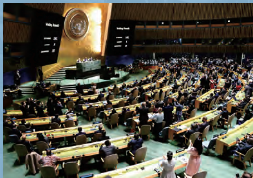
▲ 2022年3月2日，美国纽约，联合国大会第11次紧急特别会议，主题为俄乌局势。