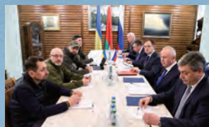
▲ 2022年3月7日，白俄罗斯，俄乌第三轮会谈举行。

俄乌三轮谈判，都在白俄罗斯。即便是已经和乌克兰外长库列巴在土耳其见过面，拉夫罗夫还是说，这场会晤替代不了俄乌在白俄罗斯的谈判。白俄罗斯，才是谈判的主要场所。