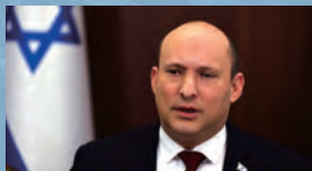
▲ 2022年3月6日，耶路撒冷，以色列总理贝内特出席内阁会议。