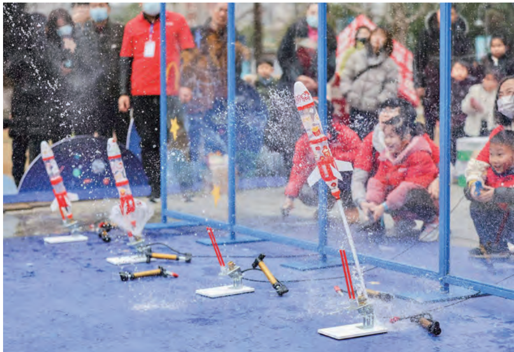
2021麦当劳“点亮梦想”长沙站活动。

归根到底，我们希望孩子们在参与过程中能收获快乐。通过“点亮梦想”活动，我们希望能和家长乃至全社会一起，珍视孩子的梦想和天性。这些小小梦想种子的力量，可能在将来的某一天在不经意间给父母和孩子自己带来惊喜。我们希望参与“点亮梦想”活动的孩子们，在自己20岁、30岁、40岁、50岁的时候，回忆童年的时候都会记得曾经有过如此美好的时刻。☑