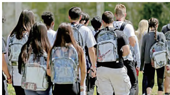
下图：美国牛津高中枪击案后学生被要求背透明书包上学。