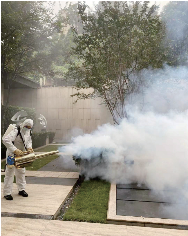
东原仁知服务在疫情期间为小区消杀。

物业相关的政策——当年10月29日，国家发改委联合多部门发布《近期扩内需促消费的工作方案》，特别提出“推动物业服务线上线下融合发展”；12月15日，住建部等六部门发布《推动物业服务企业加快发展线上线下生活服务意见》，提出以智慧物业管理服务平台为支撑，大力发展居家养老服务，提升公共服务效能等。