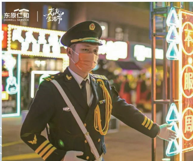
东原仁知服务为社区举办2021年老友生活节。