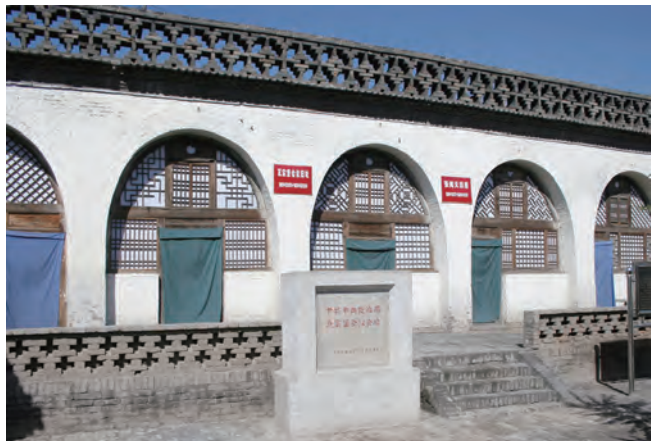
位于延安的瓦窑堡会议旧址。