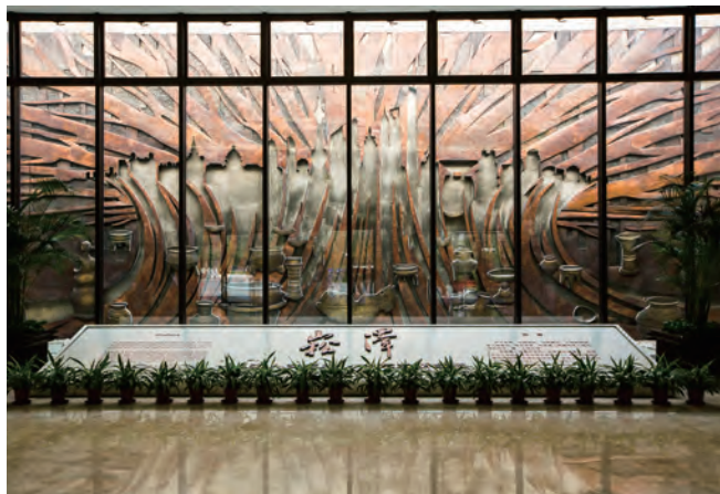
位于赵巷的崧泽遗址博物馆。