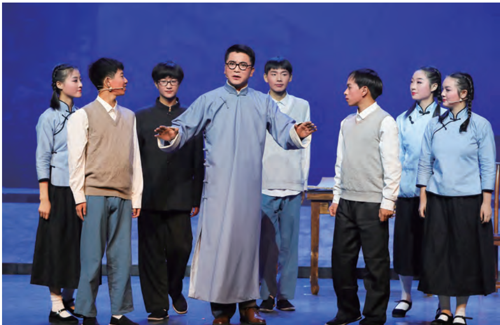
下图：黄梅戏佳作《陶行知》表现了陶行知的大爱。

学做合一”三大原理发展成“生活即学习”“生命即成长”“生存即共进”“世界即课堂”“实践即教学”“创新即未来”六个原理，将先生提出的“生活力”“自动力”“创造力”发展为“生活力”“实践力”“学习力”“自主力”“合作力”“创造力”六个核心素养与关键能力，开展继承与发展兼顾的“生活·实践”教育实验，努力将先生100多年前提出的教育思想和社会变革理想变成现实。