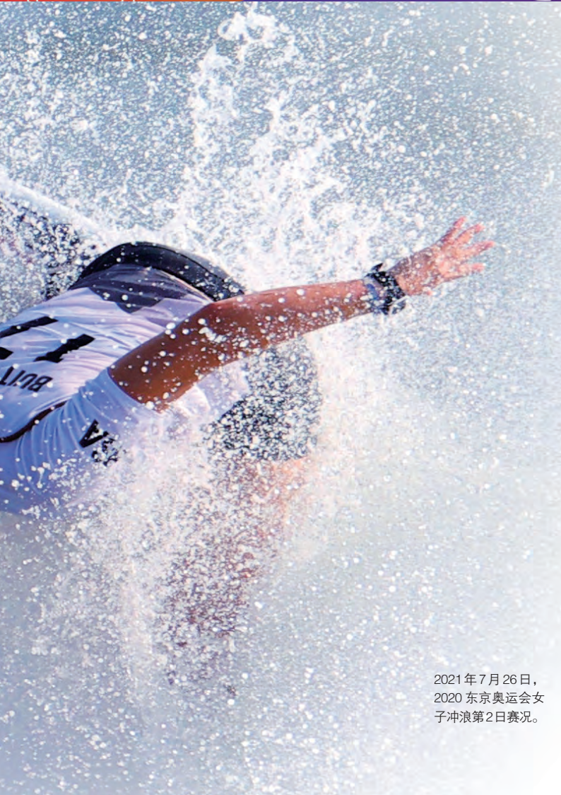
2021年7月26日， 2020东京奥运会女子冲浪第2日赛况。

“现在的年轻人有很多选择的机会，不能指望他们找上门来，我们必须主动作为。”国际奥委会主席巴赫在表决通过后表示。