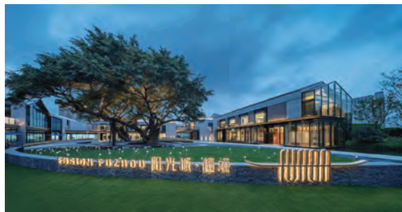
上图：福州阳光城·檀境。

据记者了解，2020 年，阳光城优秀项目获奖总数量 158 个，比 2019 年的 84 个近乎翻倍。其中，地产设计大奖 16 个、金盘奖 38 个、园冶杯 17 个。