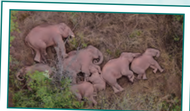
云南昆明晋宁区夕阳乡，象群原地休息。

但亚洲象都是躺着睡觉的，它们一般会慢慢地侧卧着，然后再把腿伸出去。比起人类，大象每天的睡眠时间很少，平均只有4-5个小时。