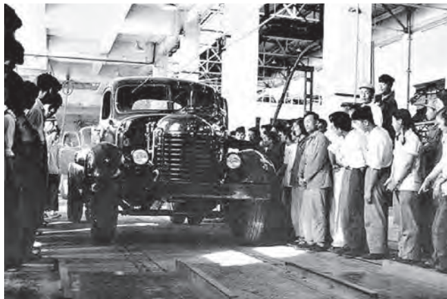
1956年7月13日，在长春一汽崭新的总装线上，装配出了第一辆解放牌汽车。