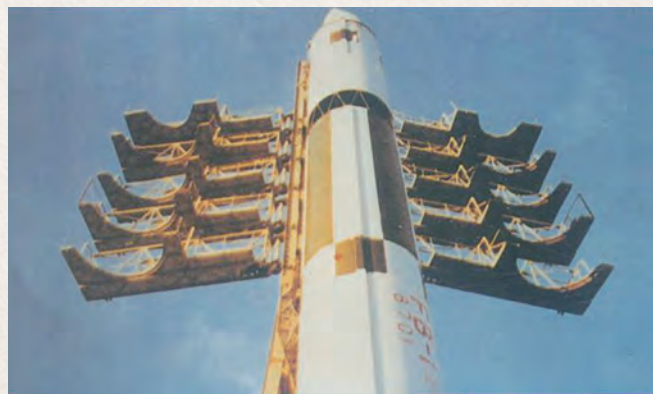
1975年7月，上海研制的风暴一号运载火箭成功地把我国第一颗重型卫星送入预定轨道。