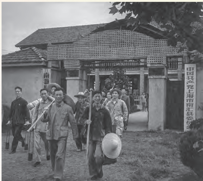
上海组织机关干部下乡、下乡参加劳动，转变作风。图为1963年6月，南汇县300多名机关干部下乡参加三夏劳动。

上海工业生产能力的提高，解放初不能生产的矿山设备、发电设备、汽车等产品逐步发展起来。图为1957年，上海试制成功第一辆国产吉普车。