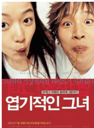
电影《我的野蛮女友》海报。