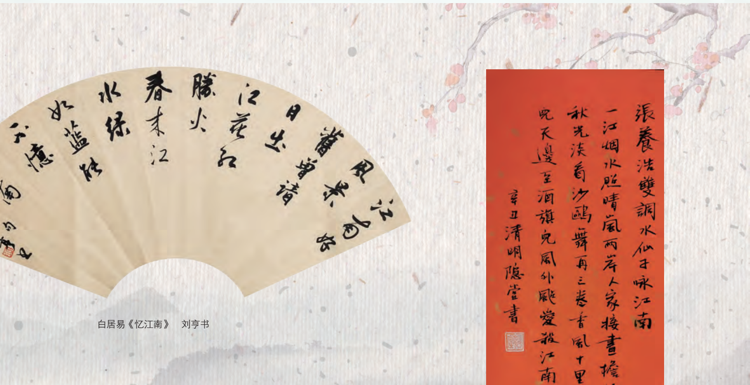
白居易《忆江南》 刘亨书