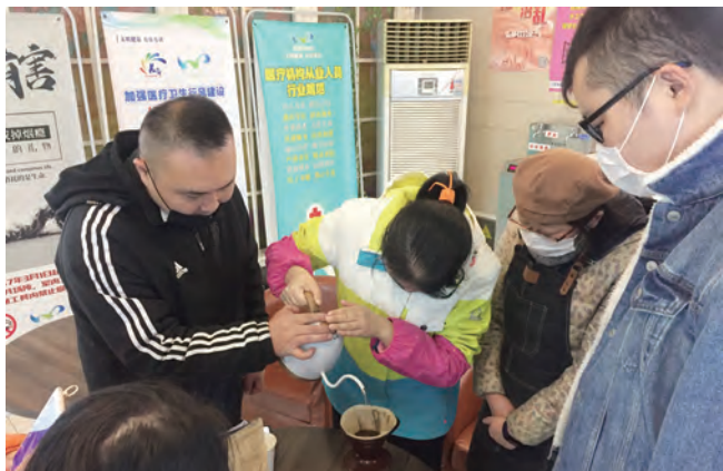
精神障碍康复者在心意吧咖啡厅接受培训。