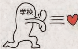
开学了，回到我的怀抱吧

眼看家长倒是复工了，神兽却迟迟不得“归笼”。等到多地疫情好转、明确了开学时间，神兽终于归笼的那一天，不少家长喜极而泣，喜大普奔，生活终于又回归了正常的轨道。