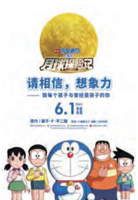
《哆啦A梦：大雄的月球探险记》。