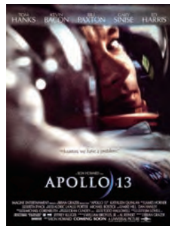
《阿波罗 13 号》。

露天玩具商贩。之后，他在巴黎郊区养老院度过了晚年最后的时光。1938 年，他在孤独中走完了自己的人生。他去世后，《月球旅行记》的结局与彩版一度失传。1993 年，受损严重的彩版拷贝被私人收藏家捐赠给西班牙巴塞罗那电影资料馆；2002 年，结局“凯旋”在法国被重新发现，影片修复计划则持续十余年，2011 年，影片的彩色完整修复版在戛纳电影节首映，人们才重新看到了这部影响深远的科幻杰作，而此时，梅里爱已去世 73 年了。